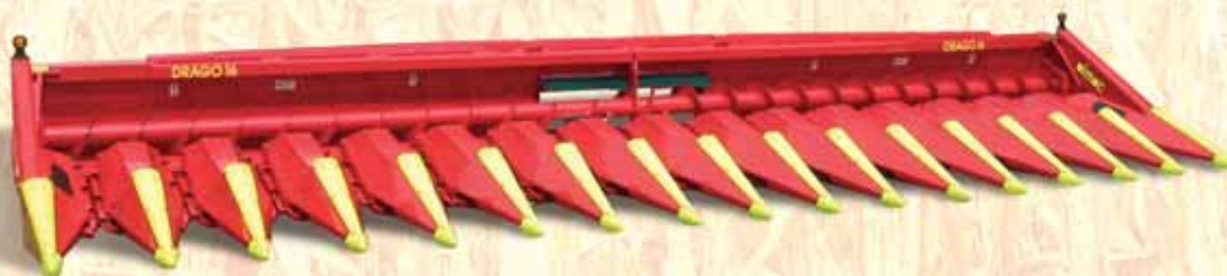
DRAGO 16-ти рядная

DRAGO: 4, 5, 6, 7, 8, 9, 10, 12, 16 РЯДНАЯ ДЛЯ ВСЕХ КОМБАЙНОВ И САМОХОДНЫХ ИЗМЕЛЬЧИТЕЛЕЙ