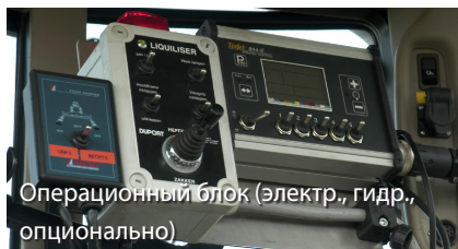
Операционный блок (электр., гидр., опционально)