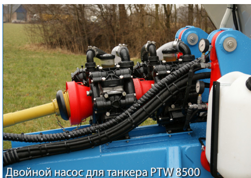
Двойной насос для танкера РТW 8500