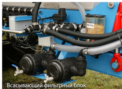
Всасывающий фильтрный блок