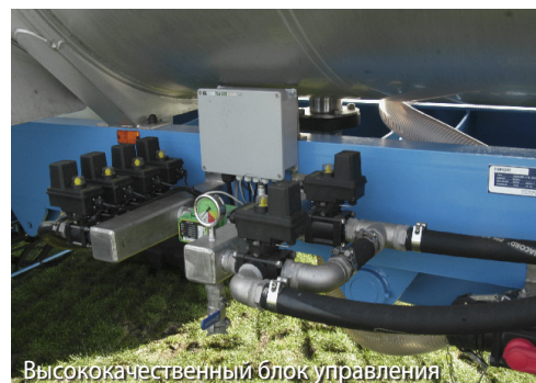
Высококачественный блок управления