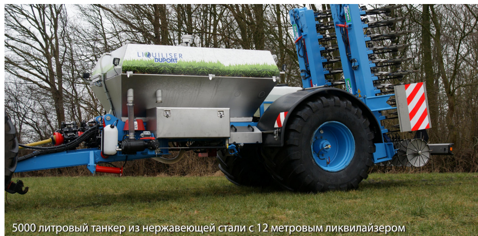
5000 литровый танкер из нержавеющей стали с 12 метровым ликвилайзером

Техническое оснащение машины может меняться в зависимости от требований покупателя.