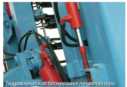
Гидравлическая блокировка ликвилайзера