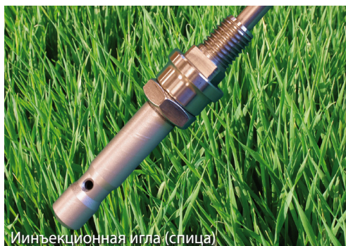
Иинъекционная игла (спица)