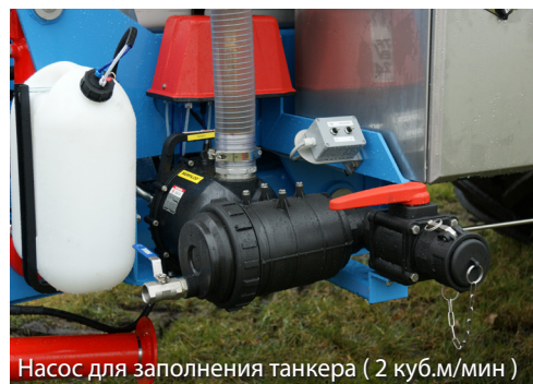
Насос для заполнения танкера ( 2 куб.м/мин )